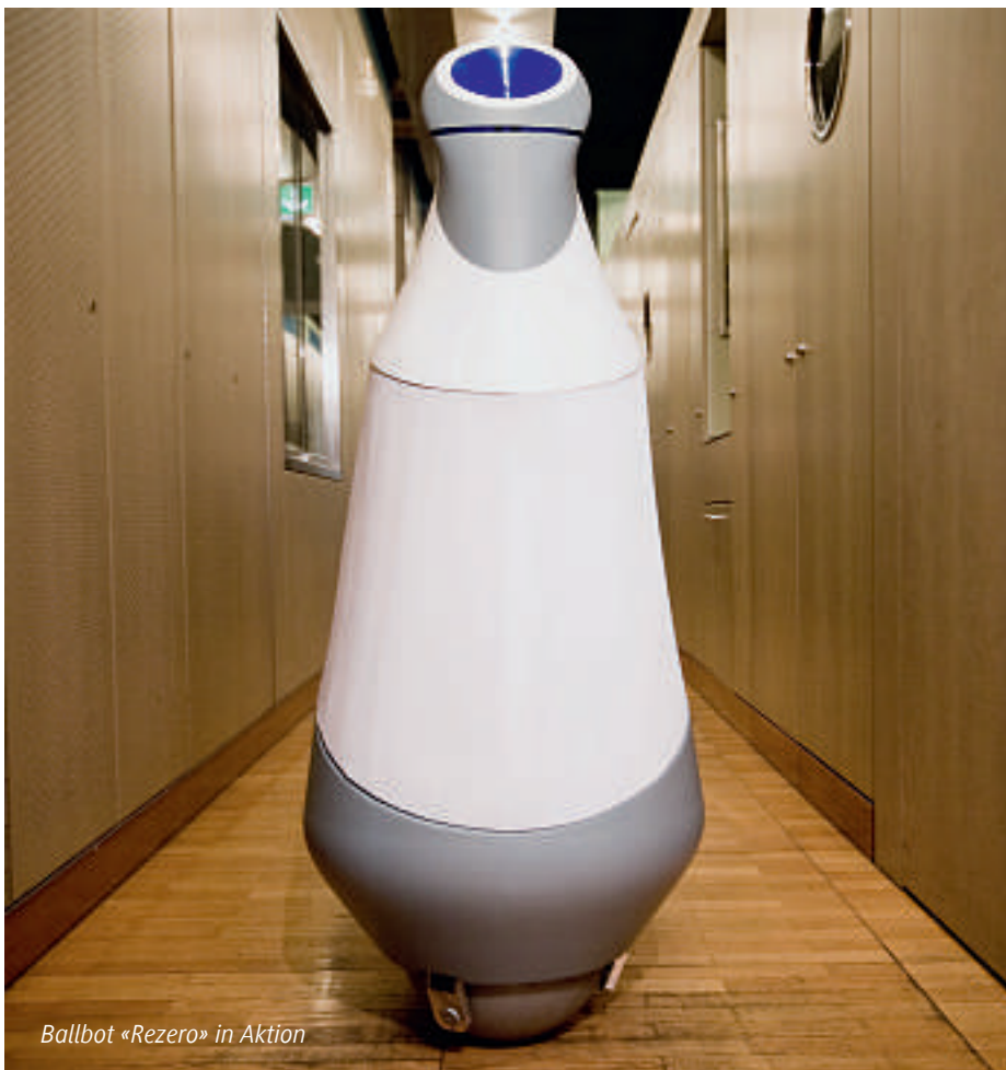
Ballbot «Rezero» in Aktion

Augenfälliges Merkmal eines Ballbots ist der «Ball», auf dem er steht. Seine Kontaktfläche zum Untergrund ist eigentlich nur ein Punkt, was ihn grundsätzlich instabil macht und höchst gefährdet umzufallen. Andererseits ermöglicht dieser Umstand die freie Bewegung in jeder Richtung und die Rotation um die eigene Achse.