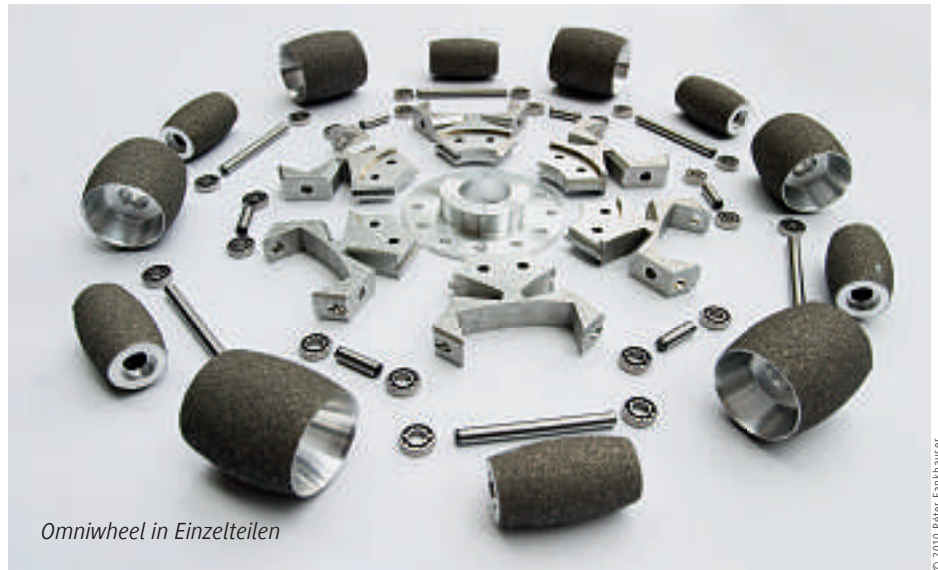
Omniwheel in Einzelteilen

Die Steuerung übernehmen zwei Rechnersysteme: ein echtzeitfähiger Low-Level-Rechner zur schnellen, präzisen Regelung von Gleichgewicht und Lage und ein High-Level-Compu-