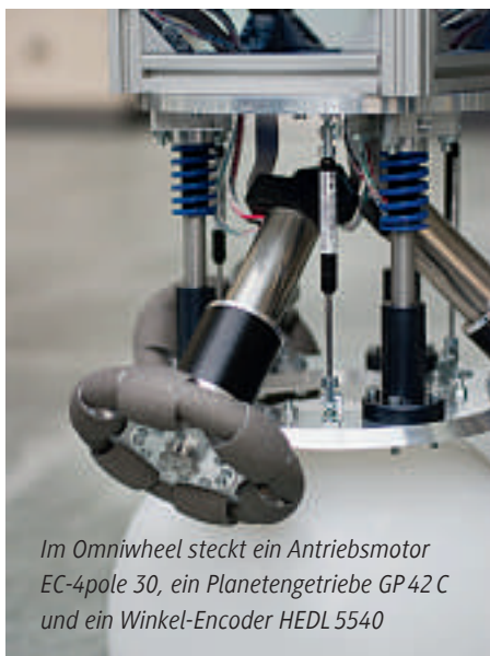
Im Omniwheel steckt ein Antriebsmotor EC-4pole 30, ein Planetengetriebe GP42 C und ein Winkel-Encoder HEDL5540